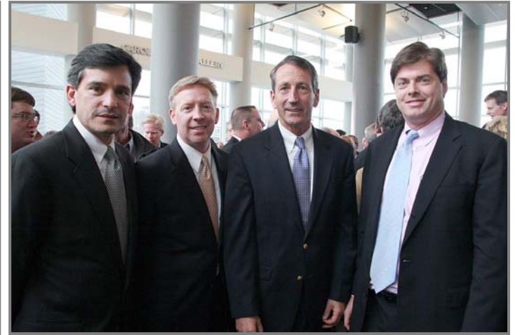
前任南卡罗来纳州州长 Mark Sanford 现身于 Proterra 新闻发布会上，宣传了 CCFI 的理念